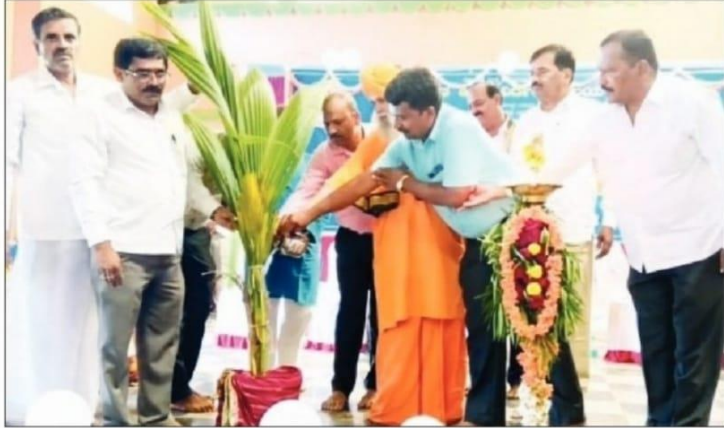
ಕುಣಿಗಲ್ ತಾಲೂಕಿನ ಫಿರಂಗಿ ಗವಿಮಠದಲ್ಲಿ ಸಂಸ್ಕೃತ ನಿರ್ದೇಶನಾಲಯದ ವತಿಯಿಂದ ಏರ್ಪಡಿಸಿದ್ದ ಸಂಸ್ಕೃತ ಶಿಕ್ಷಕರ ತರಬೇತಿ ಸೇತುಬಂಧ.

ಪಂಪರನ್ನಕಾಳಿದಾಸಸೇರಿದಂತೆ ಹಲವಾರು ಕವಿಗಳು ರಚಿಸಿದ ಸಂಸ್ಕೃತ ಭಾಷೆಯನ್ನು ಯುವಕರಿಗೆ ಕಲಿಸುವಲ್ಲಿ ಮೊಬೈಲ್, ಕಂಪ್ಯೂಟರ್ ಗಳಿಗೆ ಅಳವಡಿಸಬೇಕಿದೆ ಎಂದು ಸಲಹೆ ನೀಡಿದರು, ಇಸ್ರೋ ಅಧ್ಯಕ್ಷರಾದ ಎಸ್